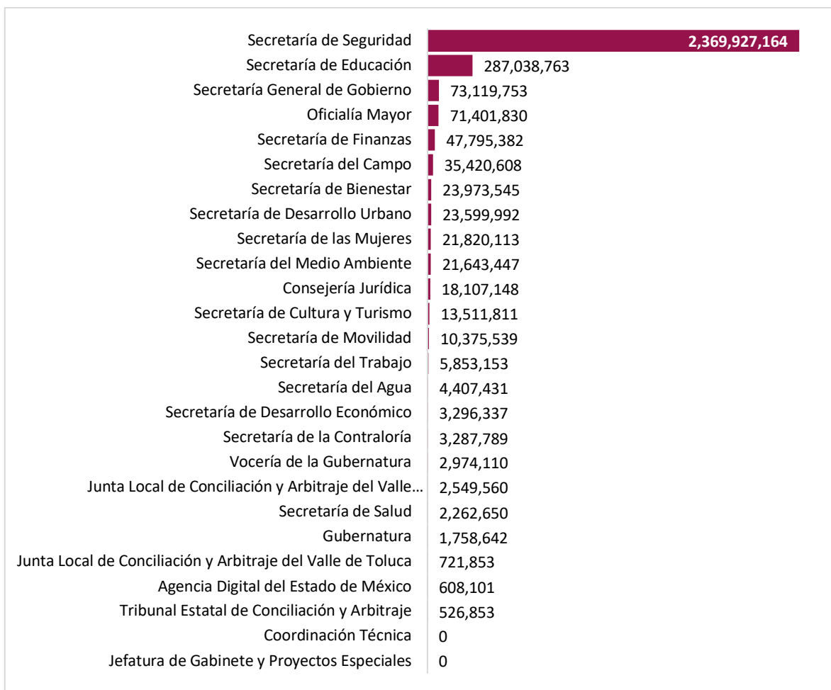
Gráfica 1. Egresos de las dependencias del Sector Central del Poder Ejecutivo del Estado de México en el Capítulo 2000 “Materiales y Suministros”, 2024 (pesos)